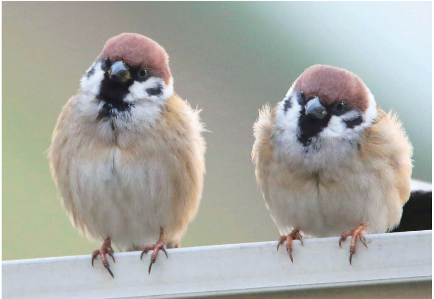
「軒先に並んだスズメたち」